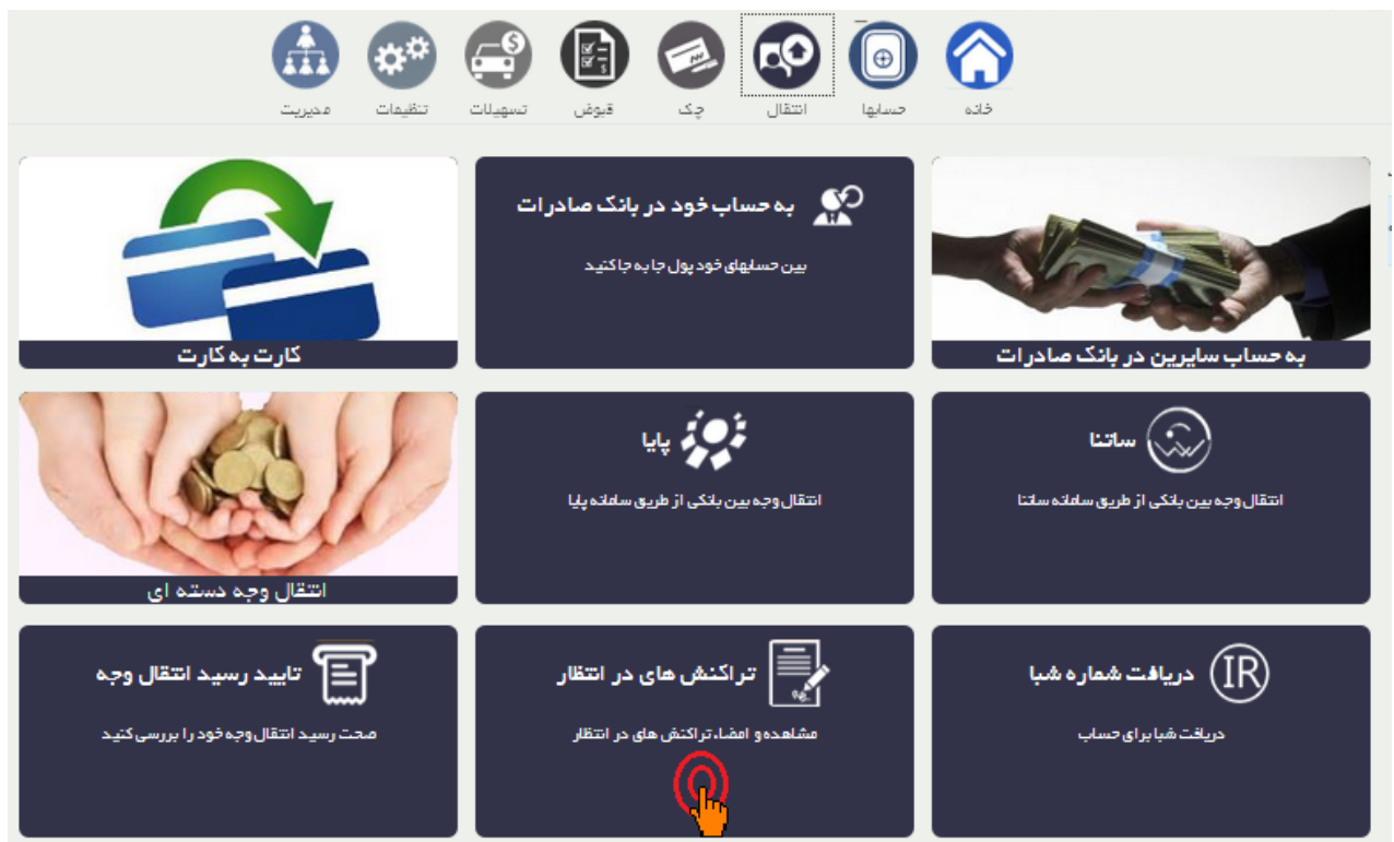
شکل شماره 9